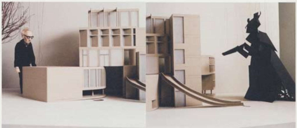
Nú er ekki tími til að láta sig dreyma, This Is Not A Time For Dreaming , 2004

In the latter part of the twentieth century French artists were not numerous in the world of international contemporary art, but toward the millennium they drew increasing attention, gaining eminence through participation in large international exhibitions. Nowadays French artists are conspicuous in prestigious international galleries such as The Marian Goodman Gallery, whose stable includes Christian Boltanski, Annette Messager and Pierre Huyghe. Other notable French artists who have come to prominence in recent years include Pierre & Gilles, Jean-Michel Othoniel, Jean-Mac Bustamante, the M/M design team, and Paris-based artists such as Thomas Hirschhorn.