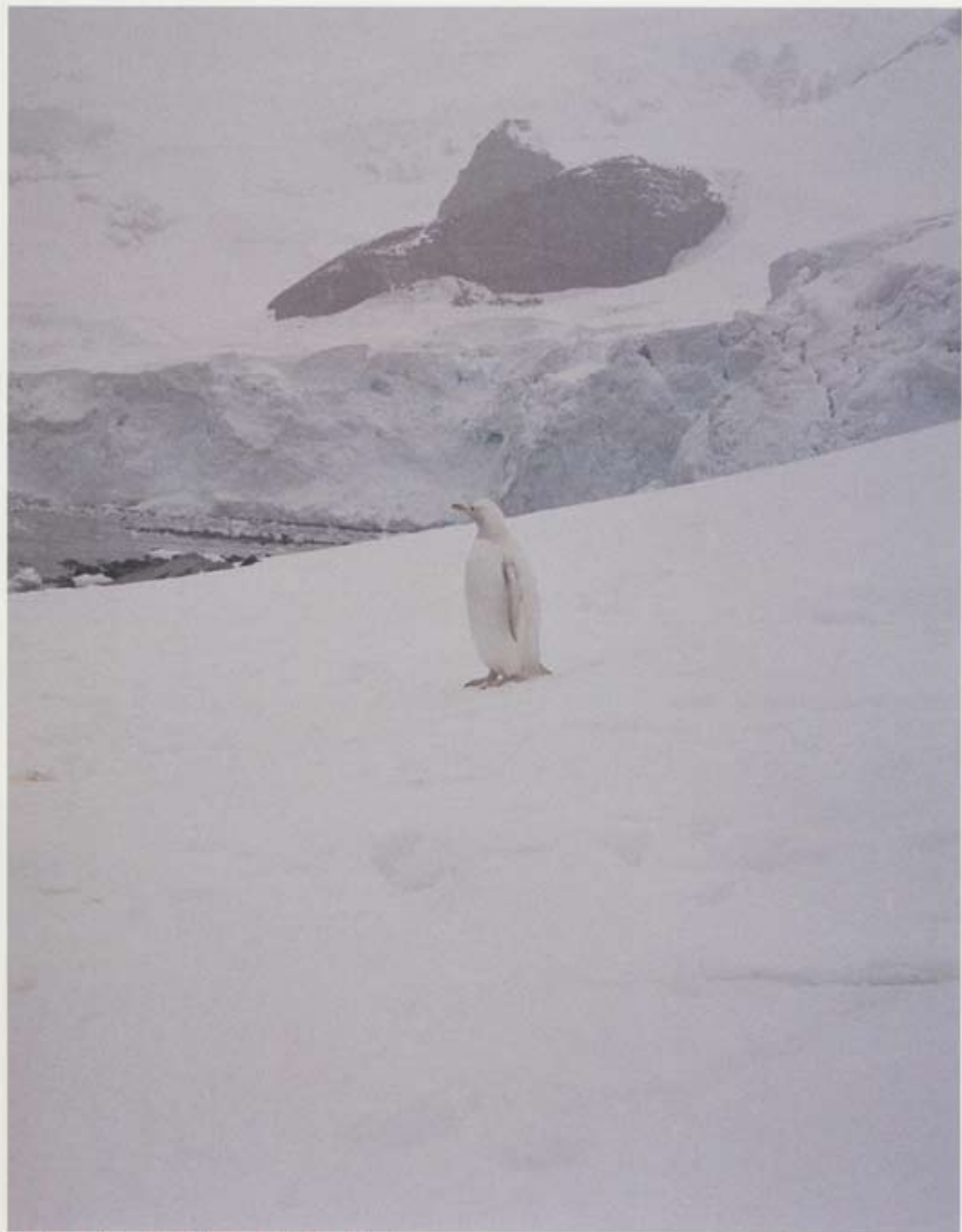
Ferð sem ekki var farin, A Journey That Wasn't, 2006